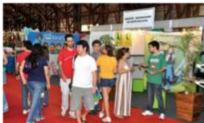
Universidade contou com estande e informou aos presentes sobre seus cursos e o vestibular do dia 20 de novembro

Conforme informações da Secretaria Municipal de Cultura e Turismo, cerca de 90 mil pessoas visitaram o Salão do Livro de Presidente Prudente, realizado de 15 a 24 de outubro. A Unoeste esteve presente nos dez dias de atividades, no Centro de Eventos IBC, através da participação de funcionários, alunos e docentes. No encerramento do evento, foi anunciada a 2ª edição, que ocorrerá de 7 a 16 de outubro de