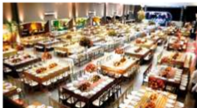
Profissional pode atuar na execução de eventos governamentais e empresariais, festas e feiras abertas ao público e eventos sociais

tamente promissor, a Unoeste disponibiliza a partir do Vestibular 2011 – com prova programada para 20 de novembro – o curso superior de tecnologia em Eventos. Trata-se de uma graduação, assim como os bacharelados e licenciaturas, mas com um diferencial: a rápida formação, pois tem duração de 4 semestres (2 anos), o que facilita a inserção no mercado de trabalho.