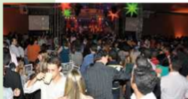
Animação tomou conta de todos os presentes na pista de dança, com apresentação da Banda Quatro Estações