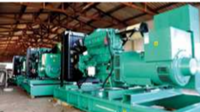
Principal benefício é a independência na geração de energia; em uma possível queda, a mesma será restabelecida de forma imediata (10 segundos)