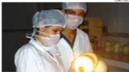
Ambiente é totalmente multidisciplinar e visa atender acadêmicos e receber visitas de pessoas interessadas

Conduzir experimentos de iniciação científica, trabalhos de conclusão de curso (TCCs), além de receber visitas da comunidade,