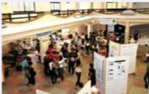
Feiras e exposições de livros, painéis e artes foram realizadas no salão do Limoeiro, campus II