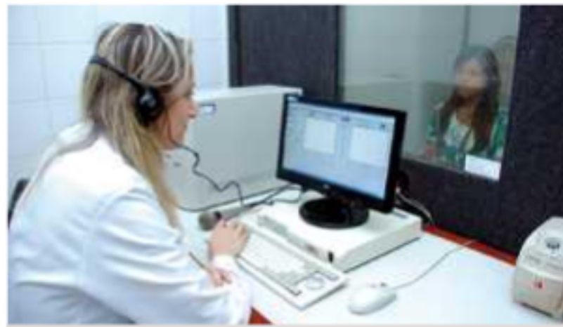
Evento da Fonoaudiologia terá atividades durante a I Semana Regional de Prevenção à Perdas Auditivas Induzidas por Ruído

Distúrbios da Comunicação Humana. O evento, que é voltado aos acadêmicos da graduação, desenvolverá as suas atividades durante a I Semana Regional de Prevenção à Perdas Auditivas Induzidas por Ruído (Pair), campanha promovida pelo Centro de Referência em Saúde do Trabalhador (Cerest/regional de Presidente Prudente), em parceria com a Unoeste e prefeituras dos municípios da região.