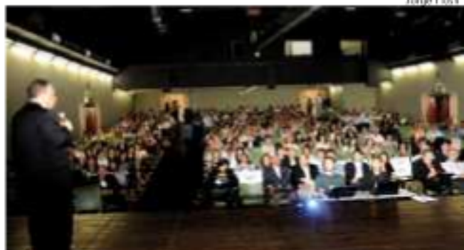
"Geração Y e a educação – Informação, reflexão e ação" foi um dos temas abordados no evento.