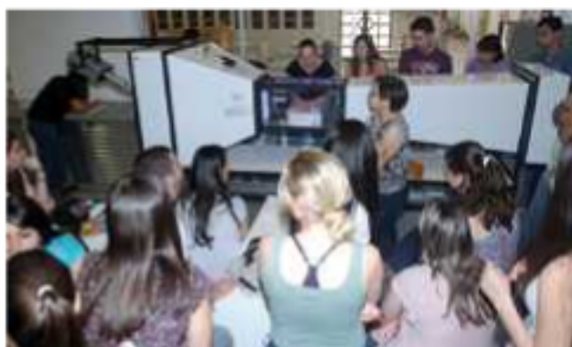
Túnel simula ventilação através de uma fumaça cinematográfica