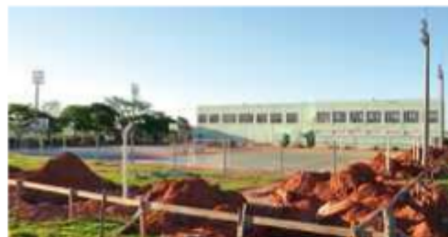
Obras para cobertura das quadras do campus II tiveram início

A Unoeste, através do Departamento de Obras (DPO), iniciou a construção da cobertura das quadras do Centro Esportivo do campus II. Além desta modificação, toda a área ao redor será revitalizada, com nova iluminação e paisagismo.