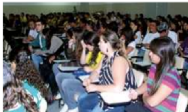
Centenas de jovens participaram de discussão sobre profissões e mercado de trabalho

do 2º e 3º ano do Ensino Médio, conta com o apoio de acadêmicos do 2º ao 10º termo do curso de Psicologia, sob a supervisão de docentes. Além de realizar um teste profissional, os jovens assistiram a um vídeo e uma palestra, conheceram as instalações da Universidade e participaram de grupos de discussões.