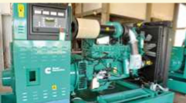
Geradores têm motor com injeção eletrônica, painéis digitais, enfim tudo o que há de mais moderno

A Unoeste fez a aquisição de equipamentos para gerar energia própria, tanto para economia quanto no caso de falta de energia. São quatro grupos de geradores capazes de atender todo o campus II, com reserva ainda de 20 a 30%. Cada gerador conta com 500 KVA atingindo um total de 2 mil KVA – fazendo um comparativo, poderia suprir até 350 residências simultaneamente. O principal benefício é a independência na geração de energia.