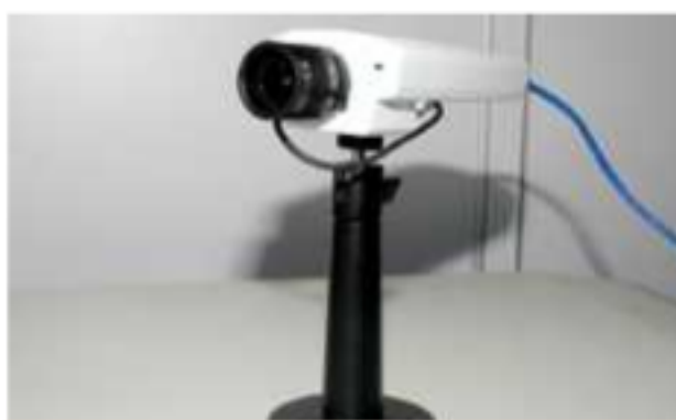
Câmera digital Axis M-1031 garante a segurança em corredores, pátios, blocos e outros locais