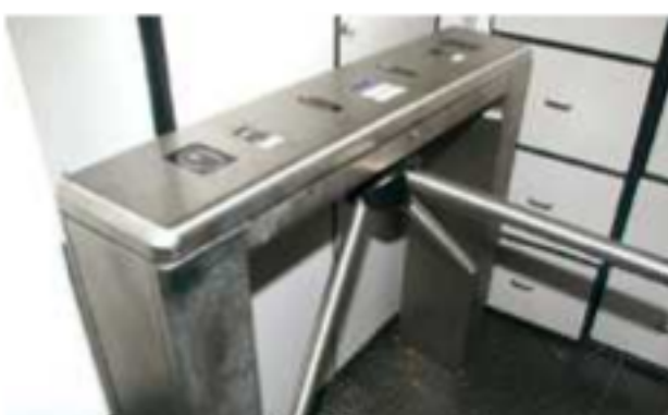
Serão instaladas 59 catracas modelo WKC Slim Evolution nos campi I e II