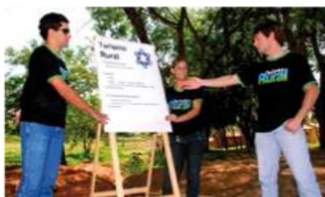
Participantes conheceram 4 estações técnicas, que foram montadas em diferentes pontos do parque