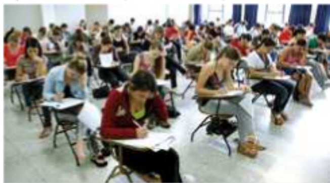
Prova será realizada no dia 20 de novembro, às 8h30, no campus II da Universidade