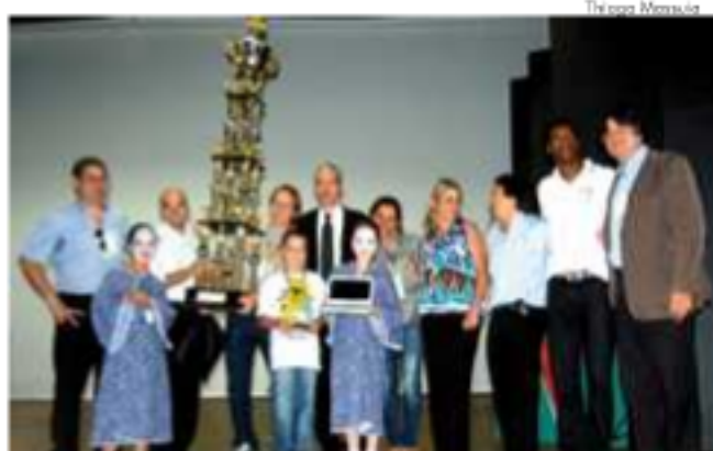
Alunos de Marília (SP) e colaboradores do evento durante entrega referente ao Ensino Fundamental I.

De acordo com o diretor de produção de conteúdo e formação em EAD – SEED/MEC, Demerval Bruzzi "os trabalhos realizados