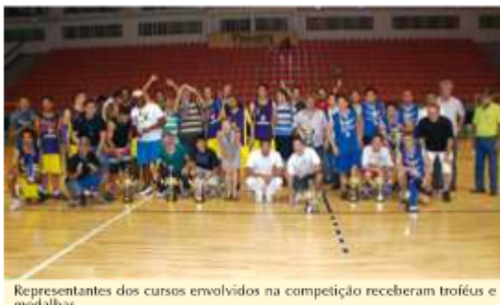
Representantes dos cursos envolvidos na competição receberam troféus e medalhas

A Faculdade de Medicina levou o primeiro lugar no vôlei (feminino) e futebol de campo e basquete (masculino). A Licenciatura em Educação Física foi campeã no vôlei e futsal (masculino). Já no futsal (feminino) o primeiro lugar ficou com o curso de Bacharelado em Educação Física.