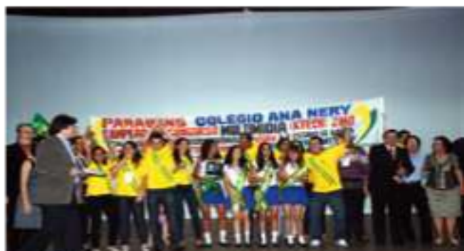
Colégio Ana Nery, de Itapicuri (BA) sagrou-se campeão do Ensino Fundamental II.

No período da tarde foi a vez de conhecer os ganhadores do IV Concurso Internacional Visual Class para alunos do Ensino Fundamental II. O primeiro lugar ficou com o Colégio Ana Nery, de Itapicuru (BA); seguido do Colégio Cotiguara de Presidente Prudente (2º) e Escola Santa Rita de Itatiba (SP) - 3º.