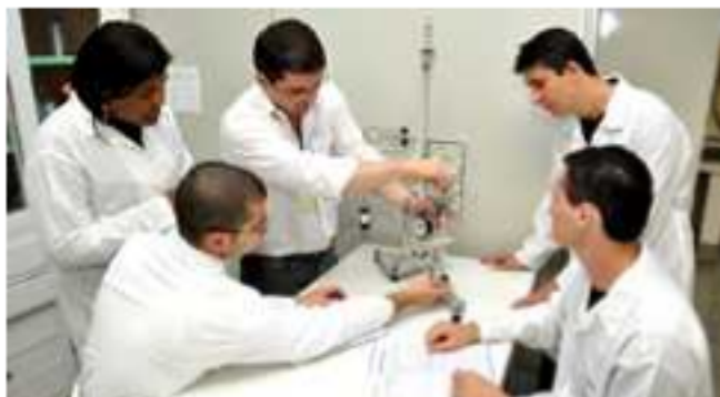
Foram analisadas questões estruturais, organização e corpo docente do curso

"A docência é uma área maravilhosa e não me arrependo de ser professor em nenhum momento, pois ensinar jovens e mostrar que a física está presente no seu dia mais do que pensa é fascinante", finaliza.